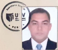
Registrado en el libro respectivo A fojas 506, tomo el N° 13