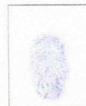
Impresión digital Índice derecho