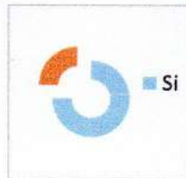
Programas Estadísticos (Minitab, Eviews, Limdep)