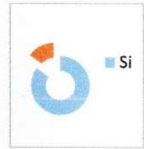
M. Power Point