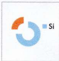
Adaptabilidad / flexibilidad