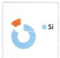
Taller de OFIMÁTICA